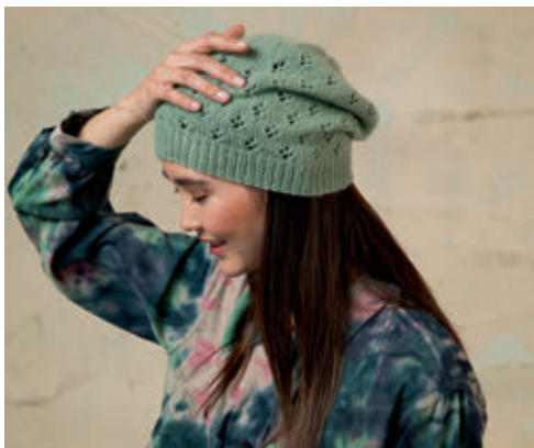
4 PIA • CASHMERE PREMIUM