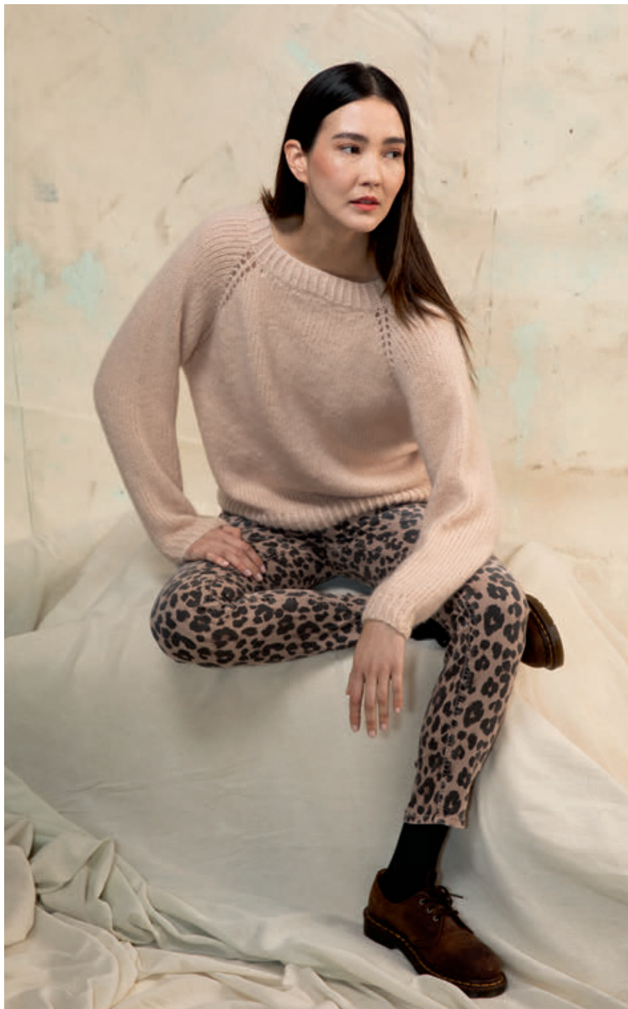
1 FABIENNE • CASHMERE LIGHT