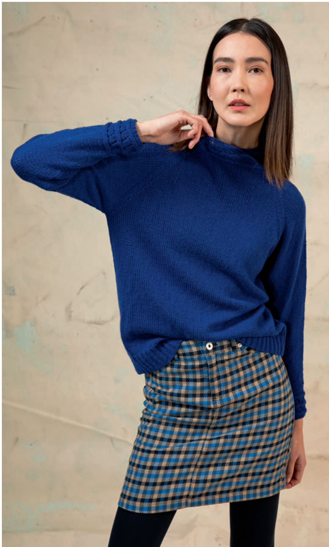
7 CLARA • CASHMERE PREMIUM