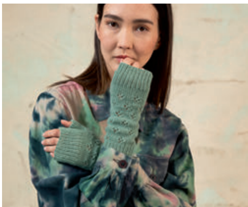
5 LISA • CASHMERE LACE