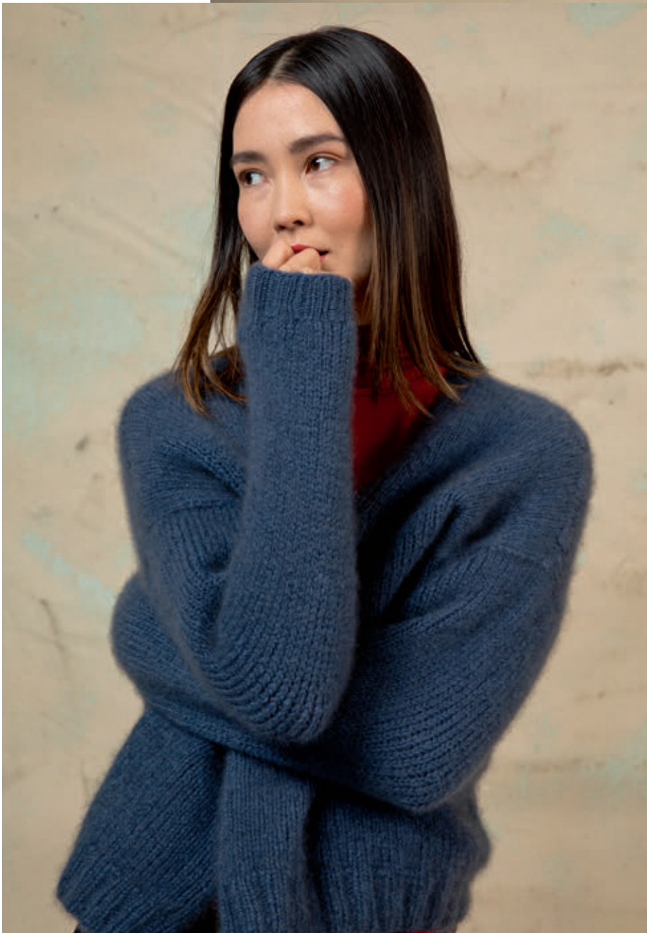
11 JASMIN • CASHMERE LIGHT